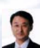
平井伸治 (鳥取県知事)